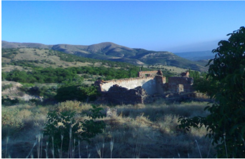
(Yıkıntı Halindeki Karadirek)