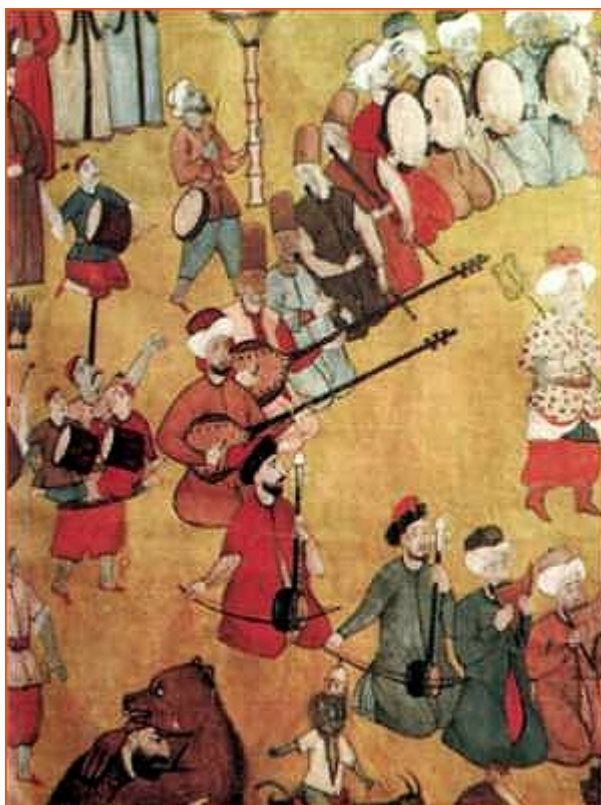
Миниатюра Камолитдин Бехзод под названием “Музыканты” (XVвек)