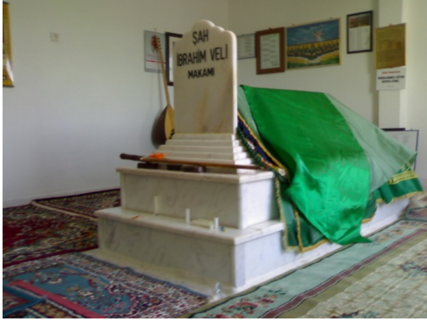
(Şah İbrahim Veli Makamı)