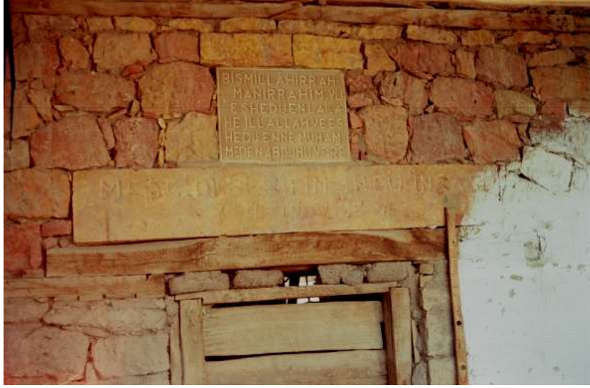
(Mescid-i Şerif'in Üçüncü İnşası, 07.04.1957)