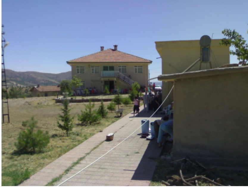
(Yeni Yerleşim Yerindeki Karadirek)